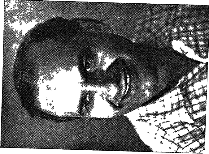
धन्वन्तरी काला पानी की सजा के बाद